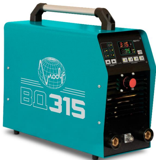
Рисунок 1.1 - Аппарат сварочный постоянного тока ВД315.1

1.7 Общий вид аппарата приведен на рисунках 1.1 и 1.2.