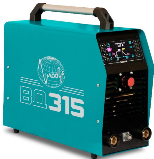
Рисунок 1.2 - Аппарат сварочный постоянного тока ВД315.2

1.8 Адрес предприятия-изготовителя Адрес предприятия-изготовителя: Высоковольтная ул.,6, г. Рязань, Рязанская обл., Россия,390013.